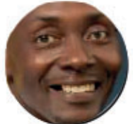
Olivier Koffi Photographe-Producteur